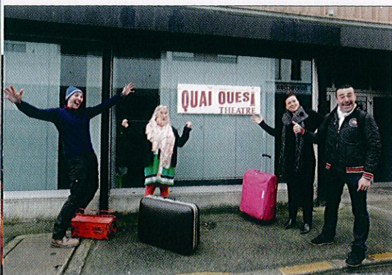
Finis le nomadisme, Quai Ouest retrouve le théâtre de Poche !

• « Médée », le 14 janvier à la Citrouille. Théâtre de Poche, rue de la Tullaye, tél. 02 96 61 37 29.